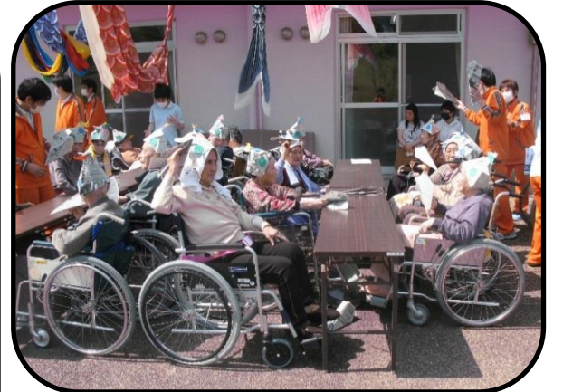
遠くに飛ばせ飛行機飛ばし