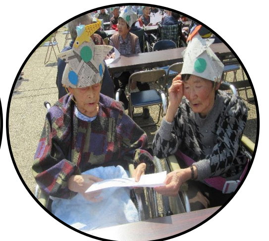
仲良く声をあわせて大合唱