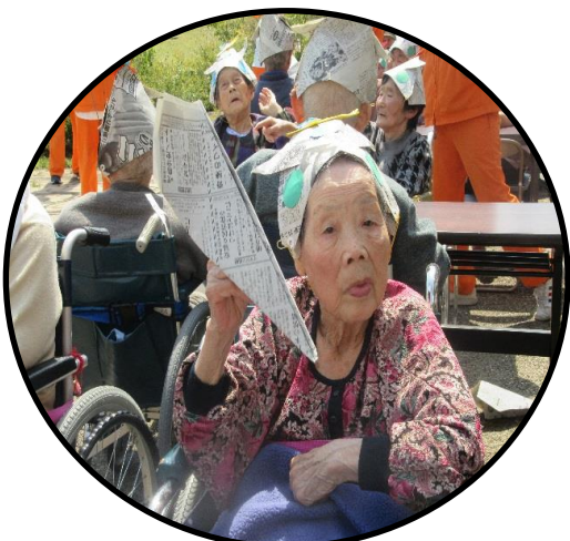
出来た飛行機に大満足