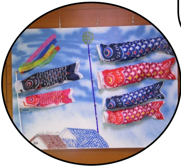
特養玄関のこいのぼり飾り