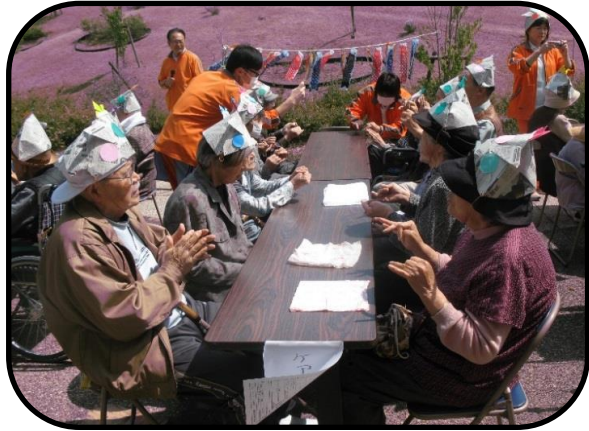
元気いっぱい指折り体操