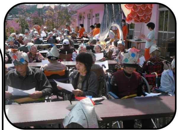
会場全体に響く全員合唱

今年もぽかぽか陽気の下で端午の節句を開催しました。利用者さんは、幸嶺園中庭を元気一杯に泳ぐこいのぼりをご覧になり「大きいから小さいのまで皆元気一杯じゃね」と大変喜ばれました。音楽療法で行っている、365歩のマーチ、ふるさとに合わせて手や身体の体操を行いました。紙飛行機飛ばしでは、利用者さん全員が昔を思い出されながら紙飛行機を作成し、青空高く飛ばされ「飛んだ！飛んだ！」と喜ばれました。会食では職員お手製の水ようかんを召し上がり、美味しいと大好評でした。最後は、全員でこいのぼりの大合唱です。幸嶺園全体に響き渡る歌声に、空を泳ぐこいのぼりもよりいっそう元気に泳ぎました。今年の端午の節句も、利用者さんの笑顔が絶えない楽しい会となりました。