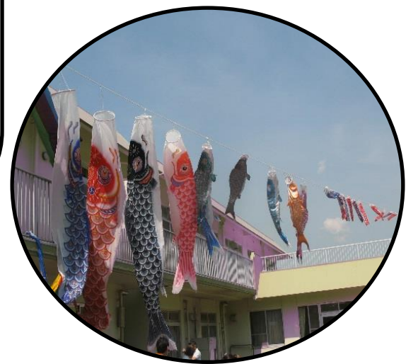
中庭を元気に泳ぐこいのぼり