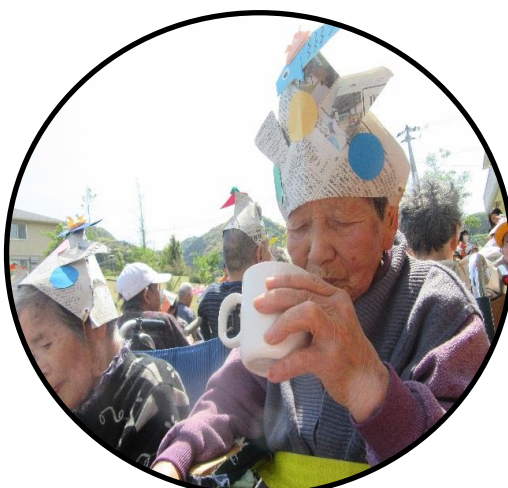
ジュースと手作り水ようかんに舌鼓