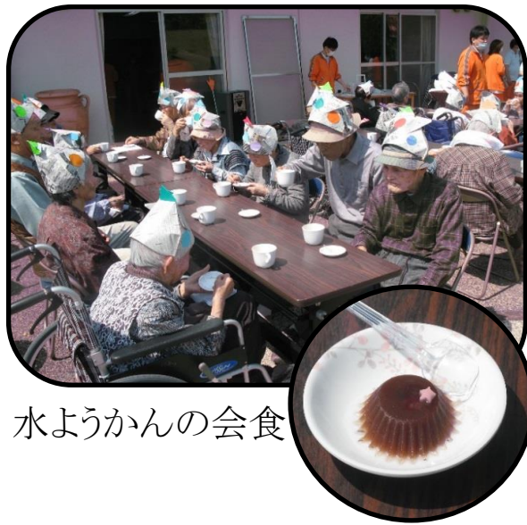
水ようかんの会食

今年もぽかぽか陽気の下で端午の節句を開催しました。利用者さんは、幸嶺園中庭を元気一杯に泳ぐこいのぼりをご覧になり「大きいから小さいのまで皆元気一杯じゃね」と大変喜ばれました。音楽療法で行っている、365歩のマーチ、ふるさとに合わせて手や身体の体操を行いました。紙飛行機飛ばしでは、利用者さん全員が昔を思い出されながら紙飛行機を作成し、青空高く飛ばされ「飛んだ！飛んだ！」と喜ばれました。会食では職員お手製の水ようかんを召し上がり、美味しいと大好評でした。最後は、全員でこいのぼりの大合唱です。幸嶺園全体に響き渡る歌声に、空を泳ぐこいのぼりもよりいっそう元気に泳ぎました。今年の端午の節句も、利用者さんの笑顔が絶えない楽しい会となりました。